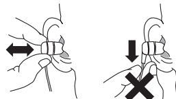
Insérer / retirer les écouteurs

Remarque : ne tirez jamais sur le câble.